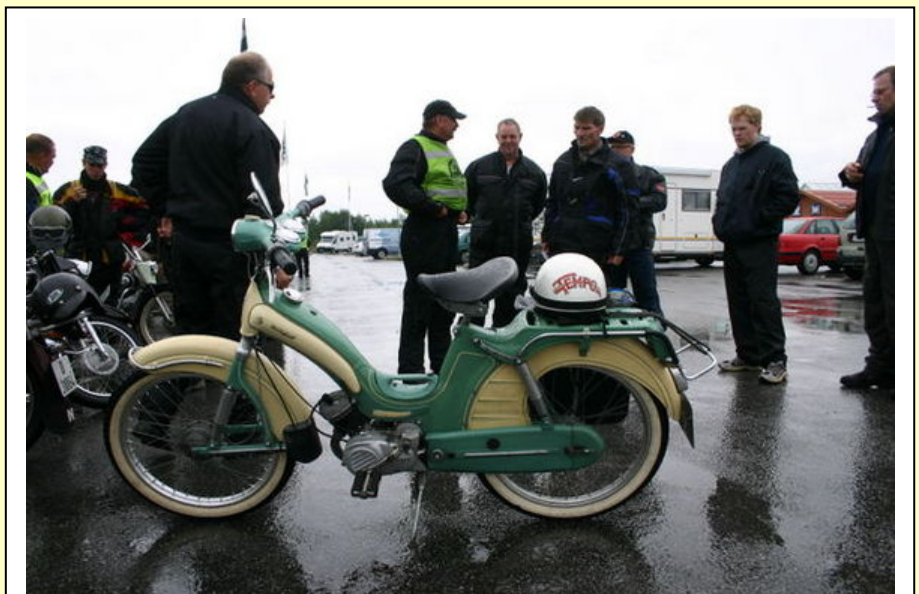
Termopeden blir beundret av andre Tempoførere. Her på Tynset under utstillingen på årets Tylldaltreff.

Senere har jeg snakket med noen som tidligere har jobbet med denne sykkelen. De kunne også bekrefte at problemet var nettopp girboksen.