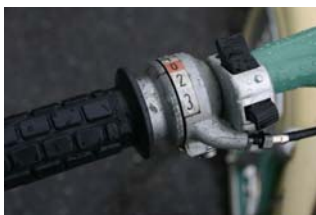
Gir handtaket. Tre gir.

Kom over sykkelen i år 2000, nærmere bestemt på Inderøy i Nord-Trøndelag. Jeg syntes den var så tøff at den måtte jeg bare ha. Den var helt komplett, men veldig nedslitt og fryktelig brun, så en helrenovering måtte til.