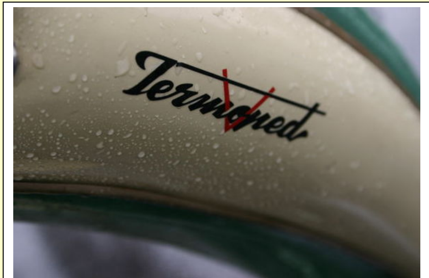
Termoped logoen som sitter på tanken.

Jeg ble oppfordret til å skrive en artikkel om Victoriaen, årsmodell 1959.: