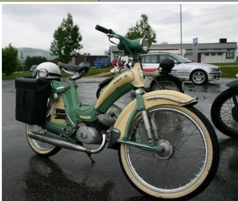
Termoped modell V