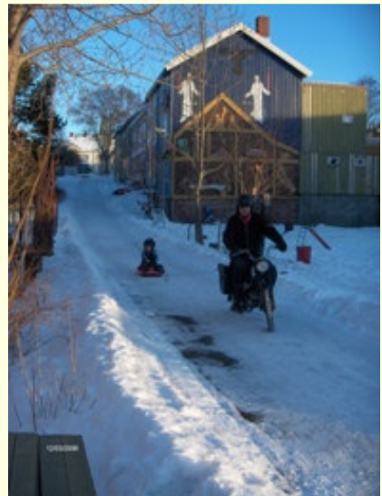
Akebrett sleping med 380

Det blir fiskesuppe på Knutholmen restaurant, jeg er eneste gjest og har en lengre temposamtale med servitrisen, hun har også en gammel Tempo. Jeg rømmer stedet når kveldens danseband begynner lydsjekken. Kjører litt rundt – overnatter på et naust.