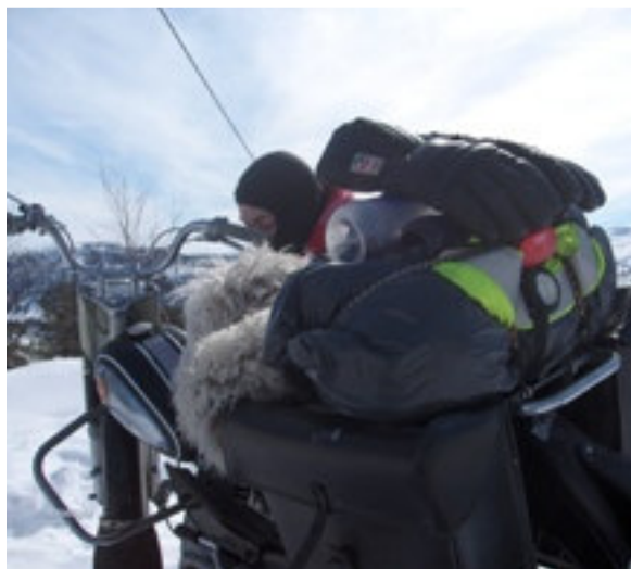
Mekking i sør Trøndelag

Tilbake til Trondheim fikk den stå på fordekket til hurtigruteskipet Nordstjernen, våres eldste og fineste hurtigrute. Da tok Tempoen seg bra ut.