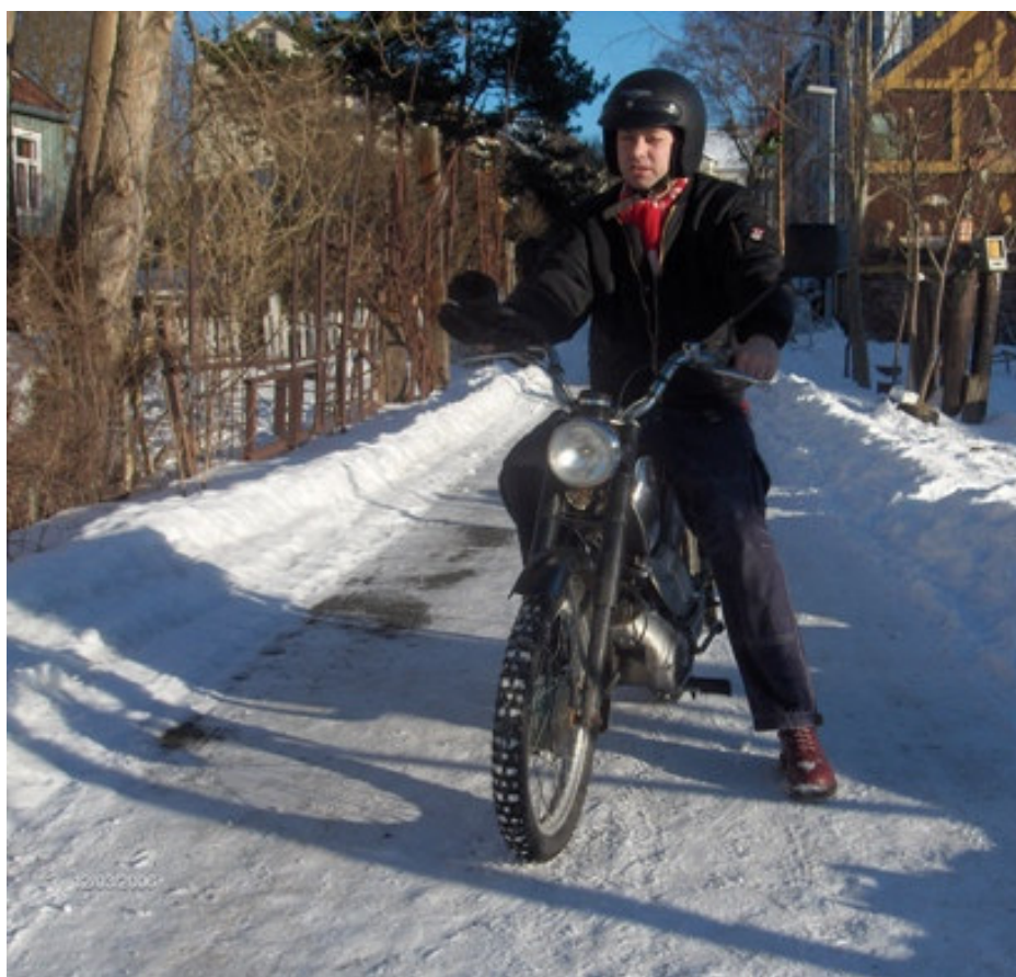
380'n på La'mon

Første dagen sto Trondheim - Ålesund for tur, en strekning på ca 35 mil uten høye fjell. Jeg startet 08.00 fra Trondheim. For lokalkjente kan jeg opplyse om at turen gikk via Orkanger, Vinjeøra og Molde. Det er i tillegg to ferger. Det var plussgrader og bare veier, trivselen var på topp helt til jeg ankom Molde - byen uten sjel.