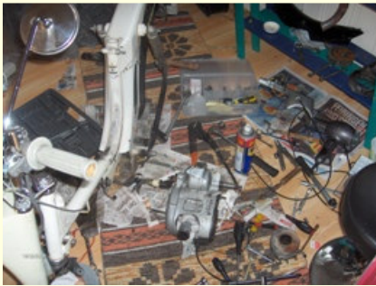
Vinter i Stua.

Andre dag begynner med feilkjøring, sinte møringer og regn. Den fortsetter med sludd, nedlagt fergeleie og flere sinte møringer. Etter to ferger og fem minutters oppholdsvær sto et lite fjell for tur. Det var under tusen meter høyt, men snøen lavet ned. Det var minst 10 cm snø i veibanen og null sikt. Tro det eller ei, dette var faktisk et av høydepunktene på turen. Vet ikke helt hvorfor, kanskje at det er litt på kanten og at den gamle lille sykkel på smale sommerdekk drar seg fremover uansett.