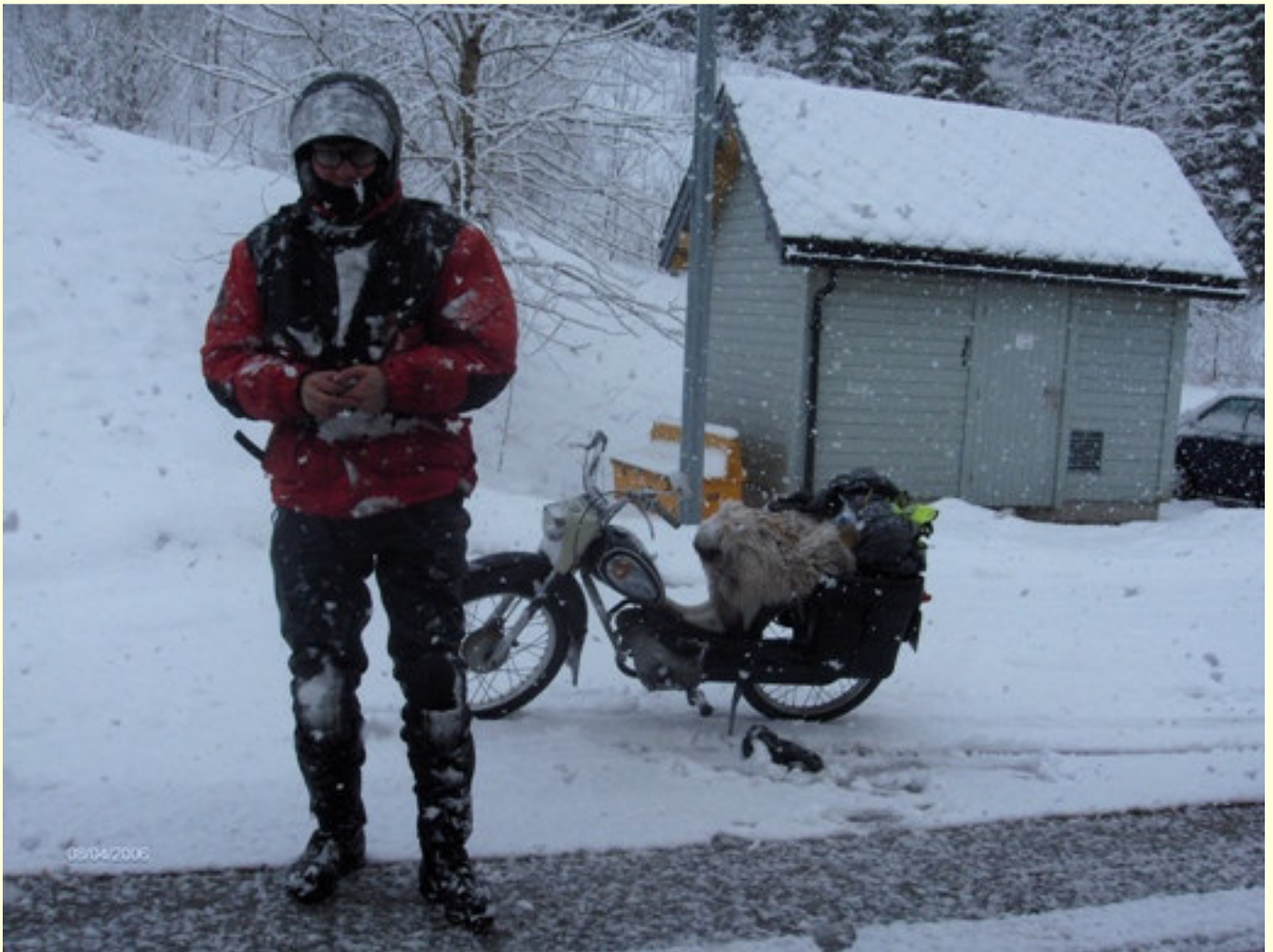
Bomstasjonen ved Nausdalstunellen.

Jeg kom ned til Førdefjorden og måtte ta inn til Førde før jeg kunne komme ut til kysten igjen, veiene er blitt bare og jeg innser at det er under en halv dag igjen til målet. Gleden tar fort slutt, jeg havner i et tungt sluddvær, vegbanen blir igjen såpeglatt, jeg må tørke av brillene hele tiden. Til slutt må jeg bare stoppe og stå som en annen tulling midt i ødemarka og vente på bedre vær.