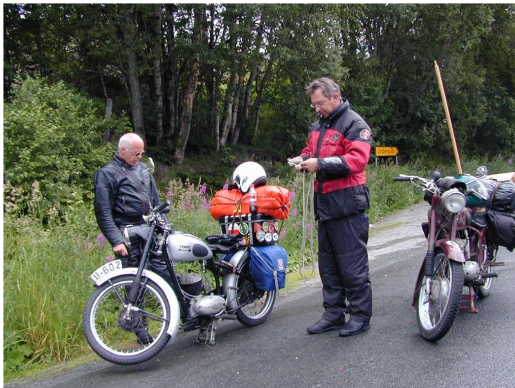
Slepeforberedelse av Tempo Gråbein.